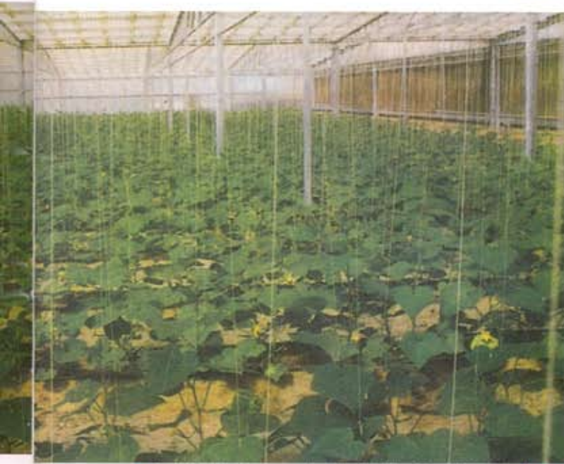
■ البيوت البلاستيكية تشكل تأثيرا يسمى مفعول «الواحة» ■