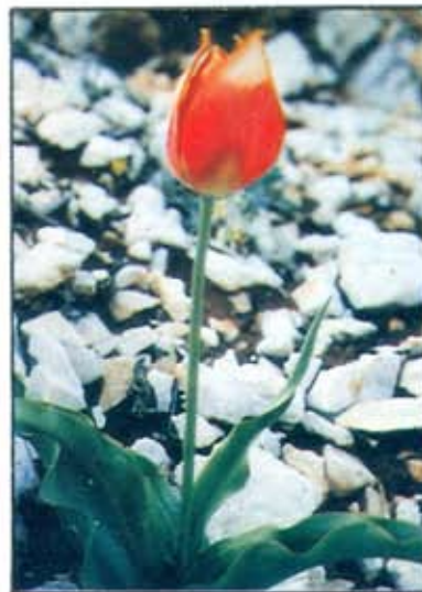
توليب ايجه - صلفنة

توليب لاون : أوراق النباتات متوسطة إلى صغيرة ، ذات لون أخضر شاحب ، الزهرة بلون أبيض