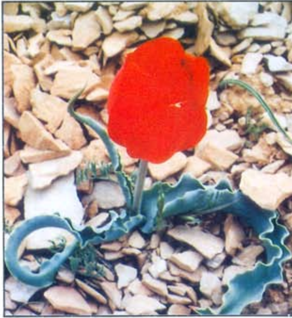
التوليب الجبلي - دير عطية