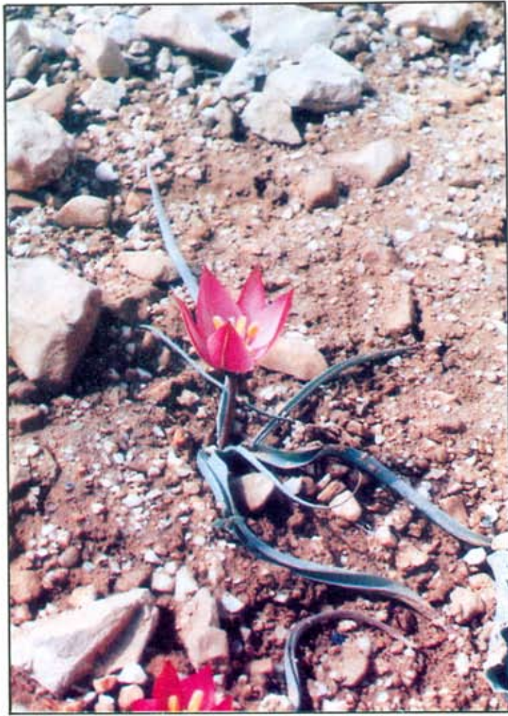
توليب اوشر - راس المعرة

الحصول على قروض من المؤسسات المالية لتغطية استثماراتهم .