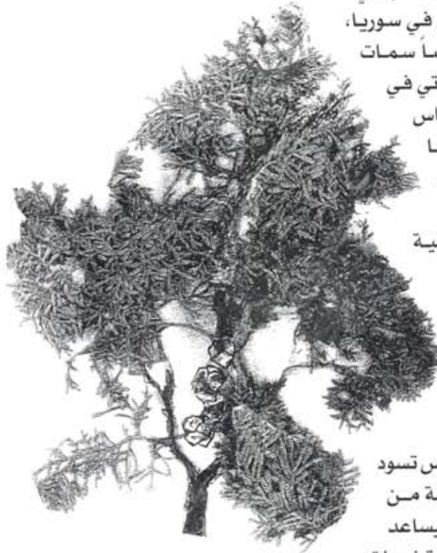
- شكل رقم (2) صورة لأشجار السرو (L. cupressus sempervirens). وفي أسفل الصورة غصن من السرو يحمل ثماراً له.