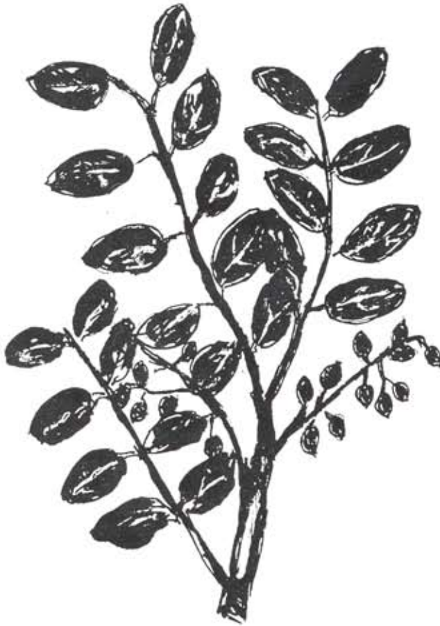
شكل رقم (4) غصن من البطم الفلسطيني ( Pistacia Palaestina ) .