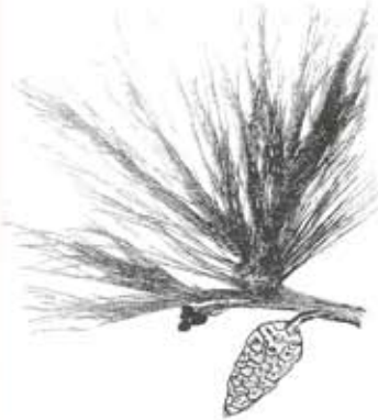
- شكل رقم (1) : صورة لأشجار الصنوبر الحلبي (Pinus halepensis) في الأعلى، وفي الأسفل غصن من الصنوبر الحلبي يحمل ثمرة.

يقصد بالفلورا (Flora) التشكيلات النباتية التي تتميز بها منطقة جغرافية معينة، وتضم الفلورا السورية واللبنانية أنواعاً نباتية مختلفة تزيد على ثلاثة آلاف نوع، وتجمع هذه في فئات الأجناس، فالفلورا السورية على سبيل المثال تصنف إلى حوالي 865 جنساً (بموجب المرجع رقم 1)، وتتميز الأجناس النباتية المميزة للمنطقة التي تقع فيها سوريا ولبنان بأن العديد من أجناسها النباتية تحمل صفة الخصائص الانتقالية ما بين المناطق المعتدلة الواقعة في شمالها ونباتات المناطق المدارية الواقعة في جنوبها، هذا من جهة، ومن جهة أخرى فإن هذه النباتات تحمل أيضاً خصائص نباتات حوض البحر المتوسط، وكذلك خصائص النباتات التي تتحمل الجفاف، والتي تميز مناطق أواسط قارة آسيا، وعلى ذلك فإن القادم من