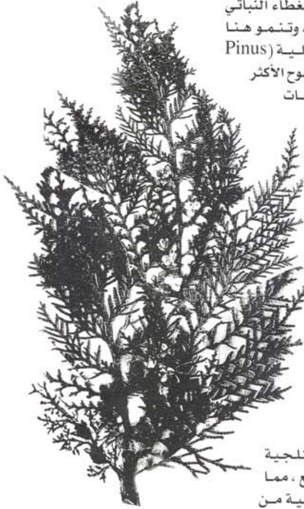
شكل رقم (5) غصن من العرعر ( Juniperus oxycedrus ) ويشير السهم إلى ثماره.

المرتفعة التي تشكل منه نطاقاً متميزاً ، يمتد بعد ارتفاع 2500 متر فوق مستوى سطح البحر.